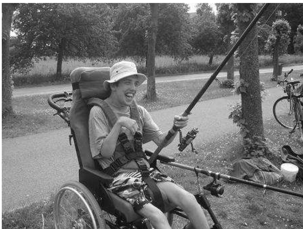
Individuální respitní péče